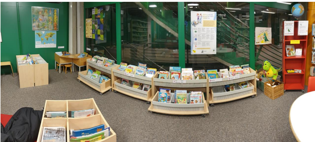
Unsere neu gestaltete Kinderecke