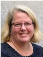
Regula Kneubühler DVD Spielfilme Sachbücher 0/6/7/8 Landkarten Kreatives in der Bibliothek Benutzerkontenverwaltung