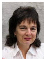
Sandra Ogi Belletristik Erwachsene Belletristik Englisch Zeitschriften Sachbücher 91 CD Rock/Pop Öffentlichkeitsarbeit