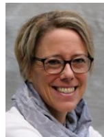
Jacqueline Marfurt Hörbuch Erwachsene Sachbücher 1/2/5 Plakate, Flyer