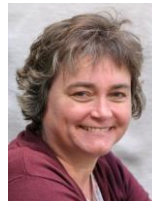
Ursi Kostiza Belletristik Jugend Comic, Hörbuch Jugend Interkulturelles Angebot Homepage, Buchstart, Kamishibai